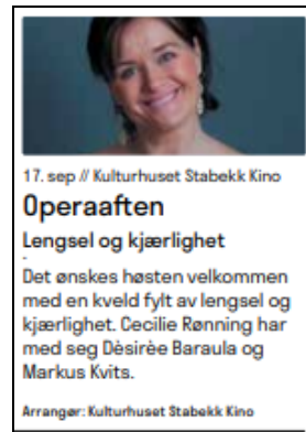
Inside 100% størrelse