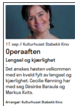
Innside ca 100% størrelse