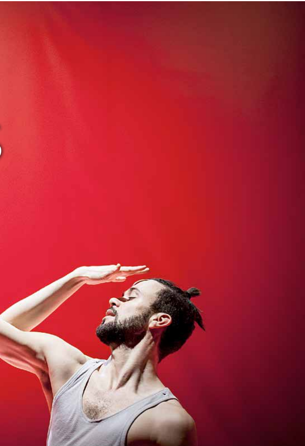
LØPING: Forestillingen Sniper's Lake handler om å løpe fra noe. Det tsjekkiske dansekompaniet har snakket med flyktninger som har fortalt hvordan det føles å være på flukt.